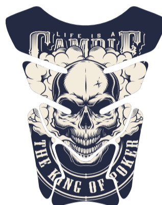
Apague todas as informações do gabarit