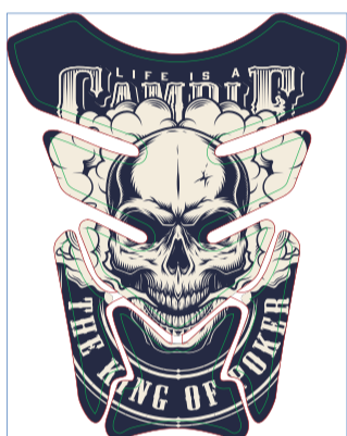
Página 1 - Frente